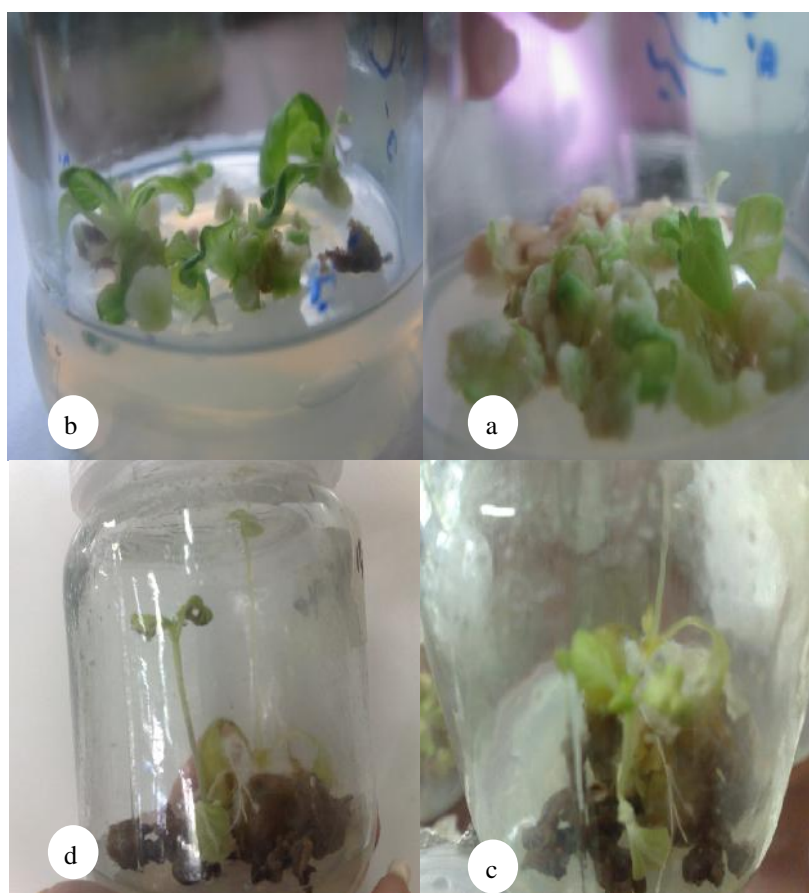
شکل ۱- a- تولید برگ‌های اولیه از کالوس، b- رشد برگ‌ها، c- ادامه رشد و تشکیل ساقه و d- شکل‌گیری اندام هوایی کامل

تعادل هورمون‌های رشد در محیط القای شاخه یک اثر کنترلی بر روی مورفوژنز دارد. سطوح مختلف هورمون‌های خارجی نقش بسیار مهمی در تشکیل شاخه دارند و شدیداً روی مورفوژنز تأثیرگذار هستند (۱۵). حدود دو هفته پس از واگشت، شاخساره‌های باززا