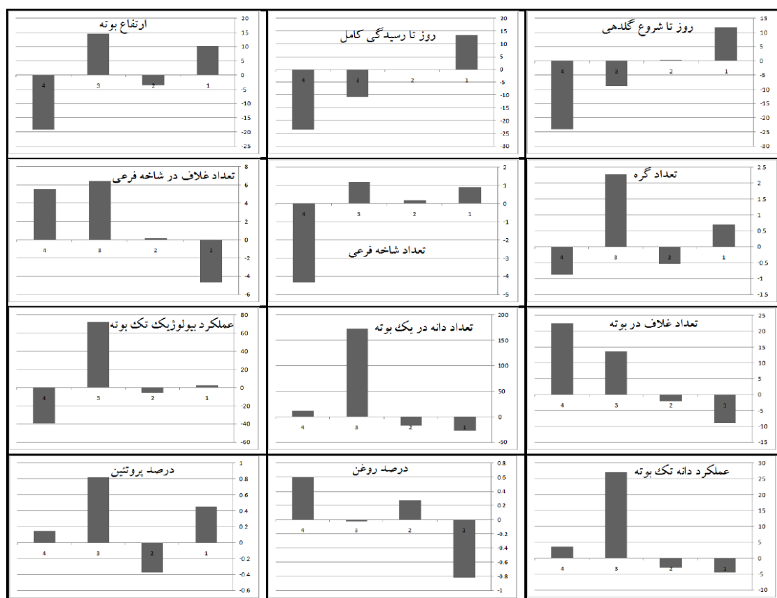
شکل ۲- انحراف استاندارد هر خوشه از میانگین کل برای صفات مختلف بررسی Figure 2. Standard deviation of each cluster from total mean for different traits

تابع تشخیص کانونی به روش خطی فیشر ۱۰۰ درصد برآورد شد که نشان می‌دهد تابع تشخیص، تقسیم ژنوتیپ‌ها در چهار گروه به وسیله تجزیه خوشه‌ای را تأیید می‌کند (جدول ۴ و شکل ۳). شفیی خورشیدی و همکاران (۲۱) با بررسی ۴۹ ژنوتیپ لوبیای معمولی از نظر ۱۴ صفت، این ژنوتیپ‌ها را توسط تجزیه خوشه‌ای در ۴ گروه دسته‌بندی نمودند و با تابع تشخیص نشان دادند که تمامی ژنوتیپ‌های مورد بررسی به طور صحیحی گروه‌بندی شدند و میزان موفقیت تابع تشخیص برای تمام گروه‌ها ۱۰۰ درصد بود. خدراحم پور و معتمدی (۷) با بررسی ۲۰ ژنوتیپ یونجه از لحاظ صفات مورفولوژیک و زراعی، توسط تجزیه خوشه‌ای آنها را در سه گروه دسته‌بندی نمودند و نتایج تابع تشخیص نیز حاکی از این مطلب بود که ۱۰۰ درصد ژنوتیپ‌ها به گروه خود تعلق داشتند.