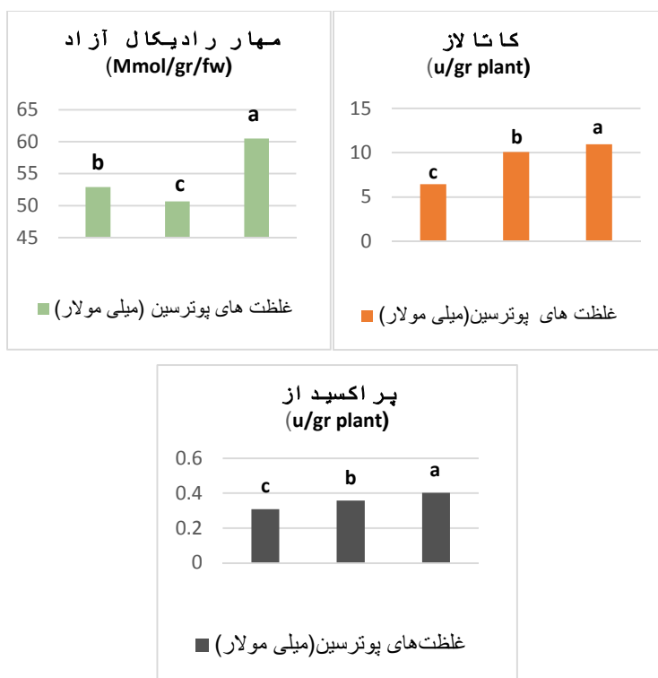
شکل ۱- مقایسه میانگین اثرات پوترسین بر آنزیم‌های آنتی‌اکسیدانی در گیاه استویا Figure 1. Means comparison of the effects putrescine on some antioxidant characters of stevia plant در هر ستون میانگین‌هایی که دارای حداقل یک حرف مشترک هستند اختلاف آماری معنی‌داری ندارند.