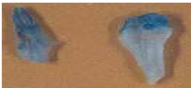
شکل ۵- برگ جوانه‌های تراریخته رنگ‌آمیزی شده با X-gluc آبی شده‌اند.

سفوتاکسیم و ۱۵۰ و ۱۰۰ و ۵۰ میلی‌گرم در لیتر کانامایسین به ترتیب در زیرکشت‌های متوالی باعث گزینش جوانه‌هایی از برگ گردید که نتایج رنگ‌آمیزی GUS همگی مثبت بود (شکل ۵). از ۲۰۰ برگ تلقیح شده در این آزمایش شش جوانه تراریخته به دست آمد و به عبارتی بازدهی تراریختی سه درصد نسبت به تعداد جداکشت بود. ژاک و همکاران (۱۵) به منظور بررسی نوع جداکشت، اثر پیش کشت، نقش ترکیب فنلی استوسرینگان و طول دوره کشت توام بر میزان تراریختی چغندر قند یک سری آزمایش‌ها با دو نوع بافت هیپوکوتیل و کوتیلدون در چندین ژنوتیپ چغندر قند و با استفاده از سیستم آگروباکتریوم تومه فاسینس حامل پلاسمید دوتائی در بردارنده ژنهای npt-II و GUS در بین مرزهای T-DNA آن انجام دادند. آنها نتیجه گرفتند که بافت کوتیلدون نسبت به هیپوکوتیل تراریختی بالاتری داشت. البته افزودن استوسرینگان باعث افزایش فراوانی تراریختی در بافت هیپوکوتیل گردید. اثر پیش کشت و استوسرینگان باعث بهبود تراریختی در جداکشت‌های کوتیلدون شد. برای مقایسه تظاهر ژن GUS در کالوس حاصل از جداکشت از روش فلورومتری استفاده گردید.