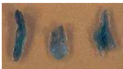
شکل ۴- جنین‌های تراریخته رنگ آمیزی شده با X-gluc آبی شده‌اند.

کمتر کانامایسین در روش اول اثر سوء کمتری روی سلول‌های تراریخته داشته‌اند. در این آزمایش، درصد جوانه‌های PCR مثبت (داده‌ها نشان داده نشده است) بیشتر از درصد جوانه‌های GUS+ بود و این امر نشان دهنده آن است که تعدادی از جوانه‌ها علی‌رغم مثبت بودن نتایج PCR آن فاقد بیان