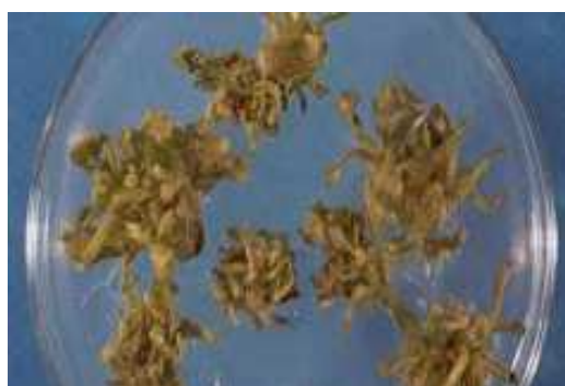
شکل ۳- باززایی جوانه از برگ هاپلوئید.

جوانه‌زایی از برگ جوانه‌های هاپلوئید: برگ‌های جوانه هاپلوئید در ترکیب هورمونی 1 \text{ mg l}^{-1} \text{ NAA} + 1 \text{ mg l}^{-1} \text{ BA} تولید جوانه‌های رویشی فراوانی از سطح برگ نمودند و این جوانه‌ها که جهت ادامه رشد به ساکارز