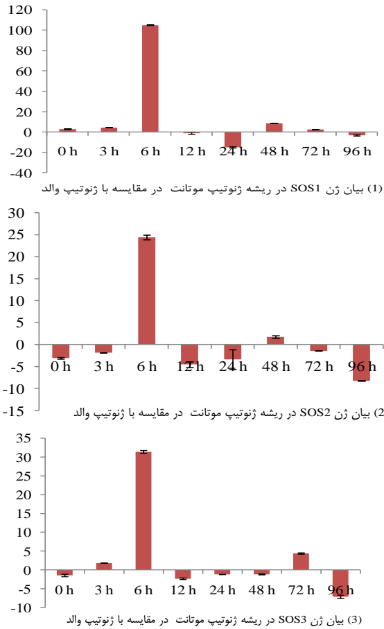
شکل ۲- مقایسه الگوی بیان ژن‌های HvSOS1 (ب) HvSOS2 ( CIPK24 ) و (ج) HvSOS3 ( CBL4 ) بین بافت‌های ریشه دو ژنوتیپ موتانت متحمل به شوری و والد تحت شوری ۳۰۰ میلی‌مولار در زمان‌های صفر (کنترل)، ۳، ۶، ۱۲، ۲۴، ۴۸، ۷۲ و ۹۶ ساعت بعد از اعمال شوری Figure 2. The pattern comparison of genes expression of HvSOS1 , 2) HvSOS2 ( CIPK24 ) and 3) HvSOS3 ( CBL4 ) between the roots of tolerant mutant genotype to salinity and parent genotype under the salinity of 300 mM at different times of 0 (control) 3, 6, 12, 24, 48, 72 and 96 hours after NaCl treatment stress

باعث فسفریله شدن و فعالیت بیشتر آنتی‌پورتر \text{Na}^+/\text{H}^+ (SOS1) واقع در غشای پلاسمایی سلول می‌شود (۲۰، ۳۲). در تحقیقی که بر روی بیان ژن TaSOS1 در گندم انجام شد، نشان داده شد که القای این ژن در ریشه بعد از ۳ ساعت اعمال تنش ۲۰۰ میلی‌مولار NaCl به حداکثر مقدار خود رسید (۳۶). بنابراین فعال شدن SOS1، موجب خروج \text{Na}^+ از سیتوپلاسم به محیط آپوپلاست سلول (۳۱، ۲۹، ۱۰) و همچنین انتقال آن از ریشه به قسمت‌های هوایی گیاه (۳۴، ۳۲) می‌شود. همچنین پیشنهاد شده است که فعال شدن این ژن منجر به ایجاد تعادل اسمزی در درون