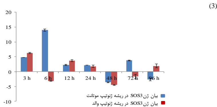
شکل ۱- الگوی بیان ژن‌های HvSOS1 (۱)، HvSOS2 (۲) و HvSOS3 ( CIPK24 ) (۳) در اندام ریشه هر دو ژنوتیپ موتانت متحمل به شوری و رقم والد تحت شوری ۳۰۰ میلی‌مولار NaCl و زمان‌های ۳، ۶، ۱۲، ۲۴، ۴۸، ۷۲ و ۹۶ ساعت بعد از اعمال تنش شوری در مقایسه با زمان کنترل (صفر ساعت)