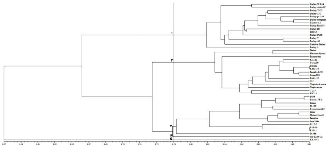
شکل ۲- دندروگرام ترسیم شده با روش UPGMA و ماتریس تشابه تطابق ساده برای تیپ‌های مختلف توتون مورد مطالعه

تجزیه خوشه‌ای به روش UPGMA و با استفاده از سه ضریب تشابه تطابق ساده، جاکارد و دایس، نشان داد که گروه‌بندی براساس ضریب تشابه تطابق ساده با ضریب کوفنتیک ۰/۹۱، مناسب‌ترین روش جهت