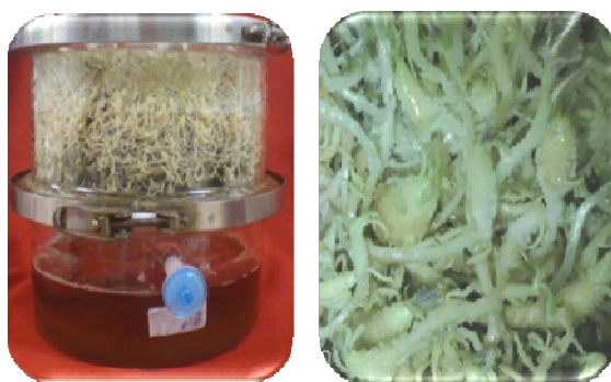
شکل ۴- تولید ریزغده‌های سالم سیب‌زمینی در بیوراکتور تناوبی.

حروف مشابه در هر ستون نشان دهنده عدم اختلاف معنی‌دار در سطح احتمال ۵٪ با استفاده از آزمون دانکن می باشد.