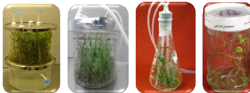
شکل ۳- مقایسه ظاهری اثر سیستم تناوبی تحت تاثیر دو فاکتور حجم و شکل ظرف در مرحله رویشی گیاهچه‌های سیبزمینی رقم آگریا.

با توجه به اینکه اکثر مطالعات مشابه انجام شده با هدف افزایش ریزگذذایی در بیوراكتور انجام گرفته است (۱، ۲۰ و ۲۳) و همچنین بررسی مرحله تکثیر در بیوراكتور باعث از دست دادن ماده آزمایشی برای انتقال به مرحله ریزگذذایی می‌شود، اطلاعات در مورد بهینه‌سازی شرایط تکثیر بسیار محدود است و بررسی صفات رویشی در این مرحله در گزارشات مشابه پیشین اندک بوده است. در این تحقیق به