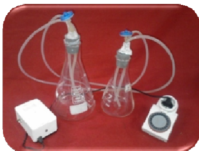
شکل ۲- بیوراکتور یک لیتری شبیه‌سازی شده با ارلن.

ریزغده‌زایی شامل ۱۰ میلی گرم در لیتر BAP و ۸۰ گرم ساکارز جایگزین محیط مرحله تکثیر شد و مخزن رشد در شرایط تاریکی کامل قرار گرفت. آزمایش در قالب طرح کاملاً تصادفی با سه تکرار انجام شد. اندازه‌گیری صفات تعداد گره، ارتفاع شاخساره، وزن تر و وزن خشک در مرحله تکثیر و صفات تعداد و وزن ریزغده به ترتیب ۴ و ۸ هفته بعد از تلقیح اولیه انجام شد.