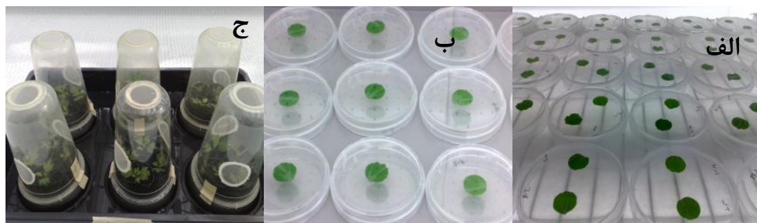
شکل ۱- الف) ارزیابی زیستی انتخابی دوگانه با دیسک برگ. ب) ارزیابی زیستی غیر انتخابی با دیسک برگ. ج) ارزیابی زیستی گیاه کامل.