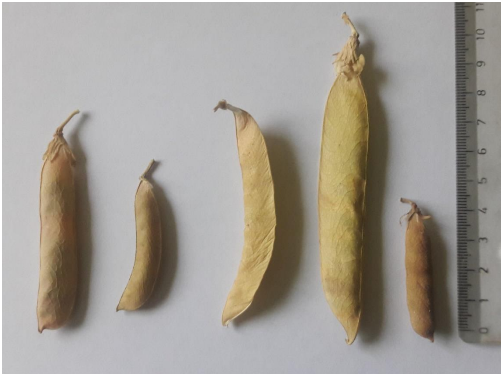
شکل ۱۱- تنوع مشاهده شده در شکل، طول، عرض، انحنا و شکل انتهای غلاف نمونه های نخودفرنگی Figure 11. The observed genetic diversity in the shape, length, width, curvature, and shape of the end of the pod of green pea accessions