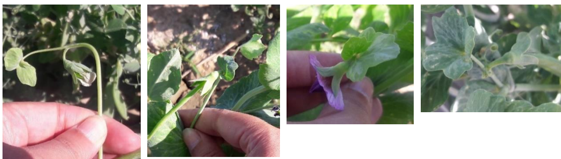
شکل ۸- تنوع مشاهده‌شده در براکت‌های نمونه‌های نخودفرنگی - بعضی از براکت‌ها بر روی اسپور قرار گرفته‌اند و بعضی از براکت‌ها مستقیماً به گل آذین وصل هستند. این صفت در دیسکرپتور موجود نیست و با توجه به مشاهده نمونه شماره ۴۷ که تمام نمونه‌ها دارای براکت خاص در تمام گل‌آذین‌ها بودند، این صفت باید در دیسکرپتورشناسایی بین‌المللی این گیاه آورده شود.

Figure 8. The observed genetic diversity in the bracts of green pea accessions - some bracts are placed on the spur and some bracts are directly connected to the inflorescence. This trait was not available in the descriptor, and according to the observation of accession 47, this trait must be included in the international Pisum sativum L. descriptor.