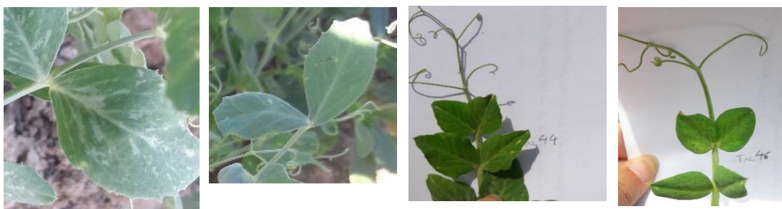
شکل ۱۰- تنوع مشاهده‌شده در شکل، حاشیه و لکه‌های روی برگ نخودفرنگی Figure 10. The observed genetic diversity in the shape, margin, and spots on the green pea leaflets