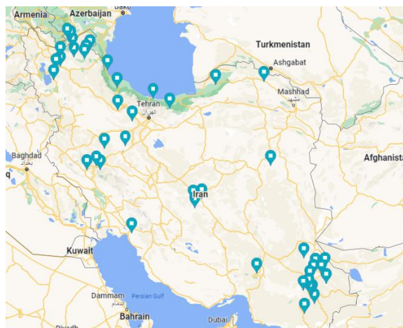
شکل ۱- مناطق جمع‌آوری نمونه‌های ژنتیکی نخودفرنگی در ایران Figure 1. Collection areas of genetic green pea accessions in Iran