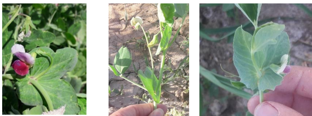
شکل ۵- تنوع مشاهده شده در طول گل آذین در نمونه های مورد بررسی - به ترتیب از سمت راست گل آذین کوتاهتر از گوشوارک- گل آذین بلندتر از گوشوارک- گل آذین هم اندازه با گوشوارک