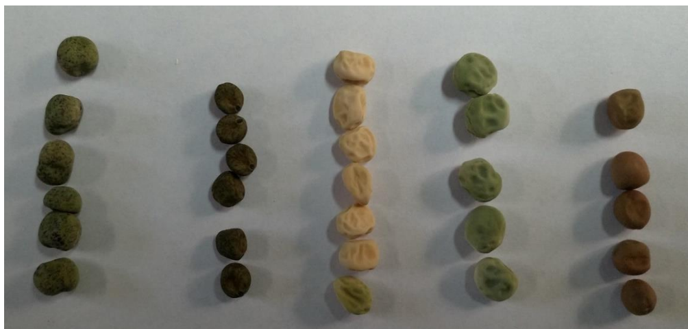
شکل ۱۲- تنوع ژنتیکی مشاهده شده در شکل، اندازه و رنگ بذر نمونه های نخودفرنگی Figure 12. Observed genetic diversity in the seed shape, size, and color of green pea accessions