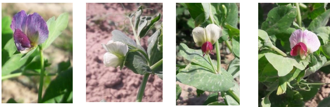
شکل ۴- تنوع ژنتیکی مشاهده شده در رنگ گل نمونه های نخود فرنگی موجود در بانک ژن گیاهی ملی ایران Figure 4. The observed genetic diversity in the flower color of green pea accessions available in the National Plant Gene Bank of Iran