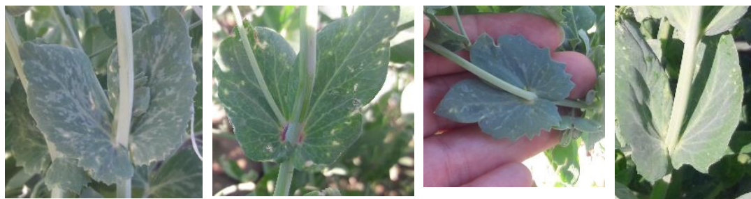
شکل ۶- تنوع مشاهده شده در شکل، حاشیه و لکه های روی گوشوارک Figure 6. Observed genetic diversity in the shape, margin and spots on the stipule