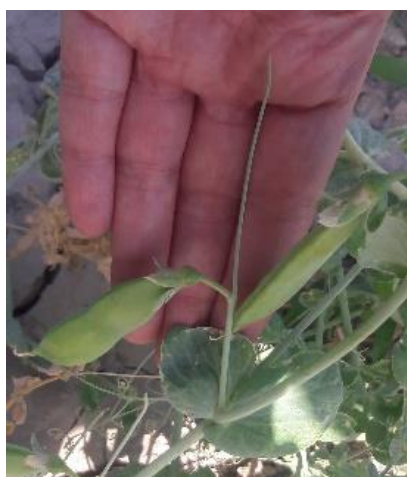
شکل ۹- در این نمونه، طول اسپور بیش از ۵ سانتی‌متر بود. Figure 9. In this sample, the spure length was more than 5 cm.

Figure 8. The observed genetic diversity in the bracts of green pea accessions - some bracts are placed on the spur and some bracts are directly connected to the inflorescence. This trait was not available in the descriptor, and according to the observation of accession 47, this trait must be included in the international Pisum sativum L. descriptor.