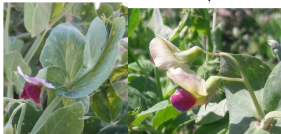
شکل ۷- تنوع مشاهده شده در تعداد گل در هر گل آذین Figure 7. Observed genetic diversity in the number of flowers per inflorescence