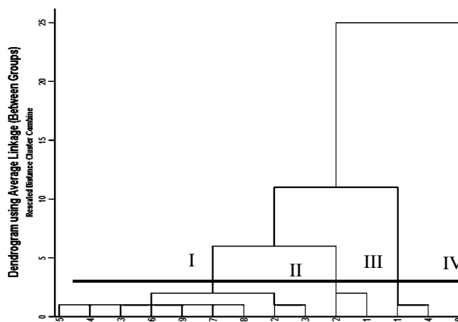
شکل ۲- تجزیه کلاستر توده‌های بومی عدس در آزمایش مزرعه‌ای Figure 2. Cluster grouping Lentil landraces in field trial