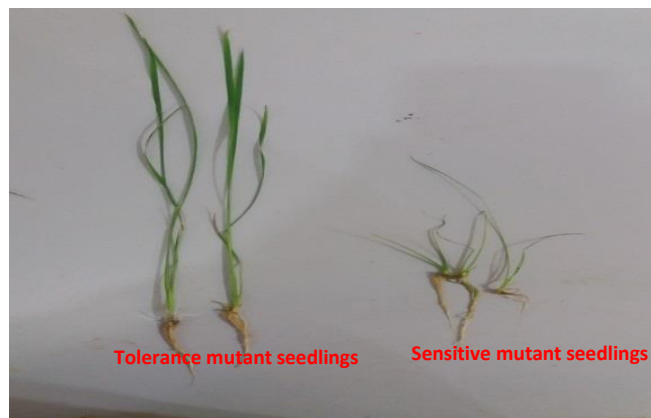
شکل ۲- وضعیت رشد و نمو گیاهچه‌های موتانت مورد مطالعه در شرایط تنش شوری Figure 2. Growth and developmental status of studied mutant seedlings under salinity stress conditions

نتایج آزمایش تنش شوری نشان داد که صفات طول ساقه‌چه، طول ریشه‌چه، وزن خشک ساقه‌چه، وزن خشک ریشه‌چه و نسبت طول ساقه به ریشه و نسبت طول ساقه به ریشه بیشترین مقدار را در تیمار شاهد (در شرایط نرمال) و ژنوتیپ‌های متحمل در شرایط تنش (کد ۳) داشتند،