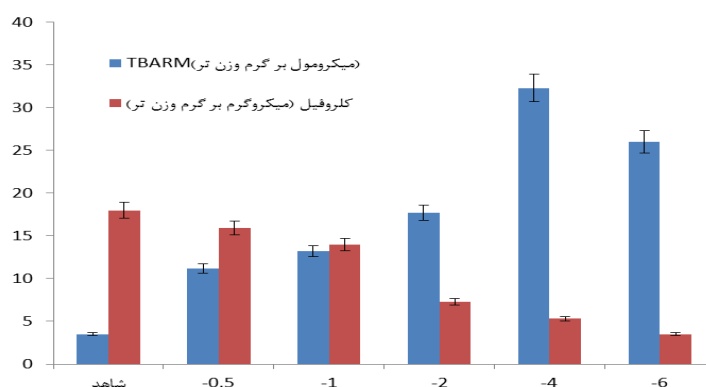
شکل ۲- متوسط مقادیر کلروفیل و شاخص پراکسیداسیون سلولی (TBARM) در شرایط تیمارهای تنش خشکی (مقادیر خطای معیار با علامت میله نشان داده شده است n=4 ).

الگوی بیان ژن روند تغییرات بیان ژن گلوتامین سیننتاز در شکل ۳ نشان داده شده است. الگوی بیان ژن مزبور در برگ به گونه ای بود که با افزایش سن عموماً افزایش نسخه برداری به طور قابل توجهی حاصل گردید. چنین به نظر می رسد که این ژن در روند فرآیند پیری برگ نقش دارد. پیری برگ مرحله ای فعال است که به لحاظ فیزیولوژیک و ژنتیکی حائز اهمیت می باشد. از مشخصه های بارز پیری برگ روند انتقال مواد آلی از برگ های مسن به اندام های جوان و ذخیره ای بویژه دانه است (۱۱). بدین منظور شکسته شدن مولکولهای حیاتی بزرگ نظیر پروتئین ها اهمیت زیادی دارد (۶). در این راستا ژن گلوتامین سیننتاز واجد اهمیت زیادی است و در تجزیه ی پروتئین ها و تعدیل اسیدهای آمینه نقش دارد (۱ و ۹). الگوی تغییرات میزان پروتئین در برگ طی مراحل نمو و میزان آن در دانه موید نتایج مورد اشاره است (جدول ۱).