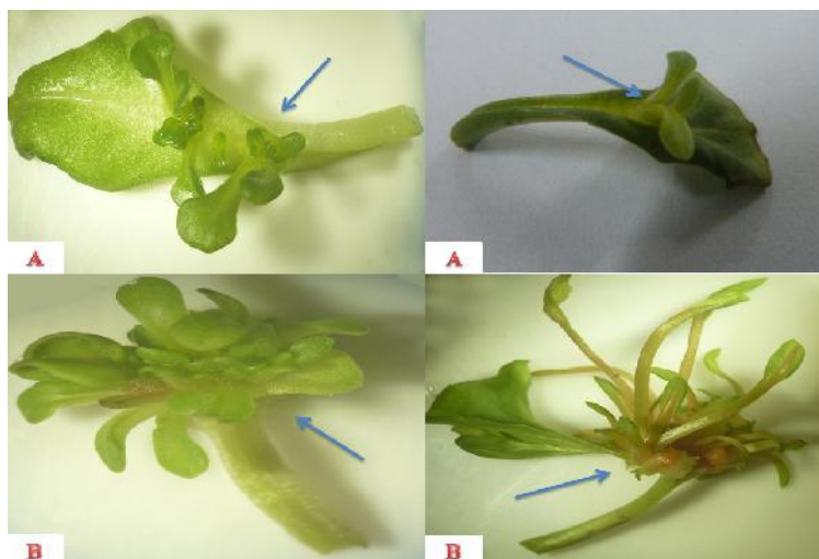
شکل ۲- ریزنمونه دارای جوانه‌های نابجا. (A) ریزنمونه‌های پهنک دارای جوانه‌های رویشی در سطح فوقانی و نزدیک به رگبرگ اصلی. (B) ریزنمونه‌های دمبرگ دارای جوانه‌های رویشی در محل برش و در قسمت‌های رأسی Figure 2. Explants with adventitious buds. A) Leaf blade explants with upper vegetative buds close to the main vein. B) Petiole explants with vegetative buds at the apical side and at cutting area