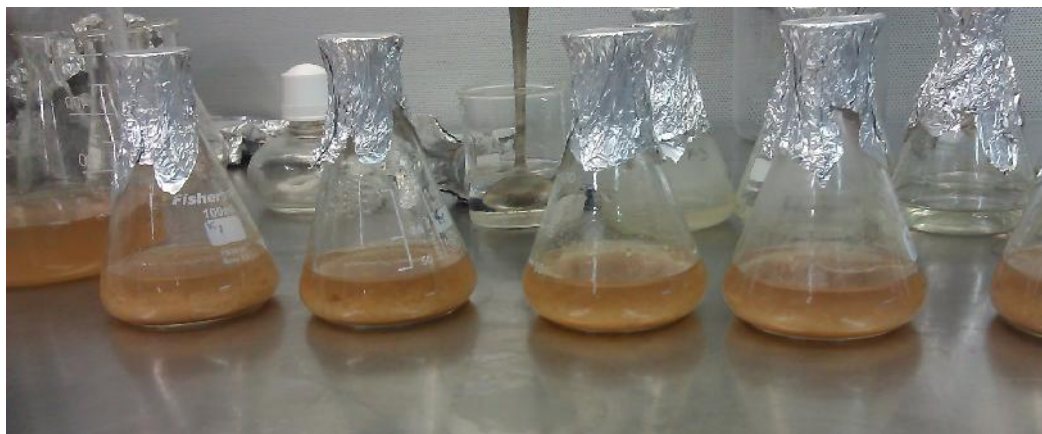
شکل ۱- سلول‌های مرزه خوزستانی در ابتدای مرحله تیمار با وانادیل سولفات Figure 1. Cells of Satureja khuzistanica at the beginning of treatment stage with Vanadyl sulfate