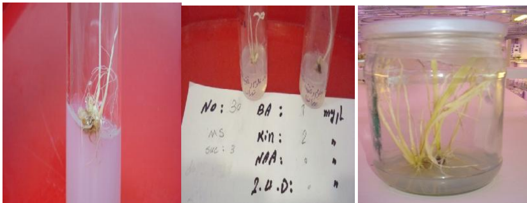
شکل ۴- گیاهان آلبینو حاصل از ترکیب ژنی شصتک / قائم // نعمت / قائم Figure 4. The Albino plantlets from crosses between Shastak/Ghaem and Nemat/Ghaem.