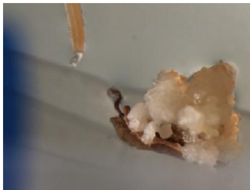
شکل ۱- کالوس حاصل از ترکیب ژنی دم‌سیاه/ قائم/ فجر/ قائم در محیط کشت N1 Figure 1. Callus derived from Crosses between Domsiah/Ghaem//Fajr/Ghaem in N1 media

همان‌طور که در جدول ۳ مشاهده می‌شود، بالاترین میزان کالوس‌دهی در دمای ۸ درجه سانتی‌گراد در محیط کشت N1 به میزان ۱۱/۱ درصد بود. بنابراین نتایج حاصله در مرحله تولید کالوس، از شش ترکیب ژنی مورد آزمایش، ترکیب ژنی