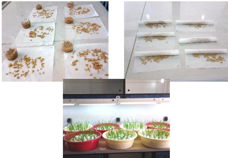
شکل ۱- کشت بذره‌های جو در درون کاغذ کروماتوگرافی و انتقال به محیط کشت هیدروپونیک Fig 1. Planting of barley seeds in chromatography paper and transfer of plantlets on hydroponic condition

آزمایشی بر پایه طرح بلوک‌های کامل تصادفی با دو تکرار در شرایط کشت هیدروپونیک در آزمایشگاه دانشگاه زابل در سال ۱۳۹۲ انجام شد و ۷۲ لاین دابل هاپلوئید جو (لاین‌های شماره ۱ تا ۷۲) به همراه والدین آن‌ها (استیتوئه و مورکس با شماره‌های ۷۳ و ۷۴) مورد بررسی قرار گرفتند. به منظور جوانه‌دار کردن بذرها، ابتدا بذرها پس از شست و شوی اولیه به مدت ۲۴ ساعت درون لیوان خیسانده شده و سپس در کاغذ کروماتوگرافی کشت شدند. پس از سبز شدن، گیاهچه‌ها به محیط کشت هیدروپونیک محتوی محلول غذایی هوگلدن تغییر یافته (جدول ۱) انتقال یافتند. دو هفته بعد از انتقال به محیط کشت هوگلدن، برخی صفات مورفولوژی یادداشت برداری شدند (شکل ۱). صفات مورد بررسی در این مطالعه، شامل: وزن تر و خشک ریشه (گرم)، وزن تر و خشک بخش هوایی (گرم) و نسبت آن‌ها، طول ریشه و ساقه (سانتی‌متر) و نسبت آن‌ها، طول بلندترین برگ (سانتی‌متر)، طول کل گیاه (سانتی‌متر)، تراکم کلروفیل، میزان رطوبت نسبی برگ (RWC) و ضریب پایداری غشاء بودند. میزان رطوبت نسبی برگ (RWC) و ضریب پایداری غشاء از طریق روابط زیر محاسبه شد (۹):