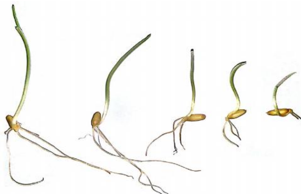
شکل ۱- تأثیر دُزهای مختلف پرتو گاما (از چپ به راست به ترتیب صفر، ۱۰۰، ۲۰۰، ۳۰۰ و ۴۰۰ گری) بر جوانه‌زنی بذر رقم سرداری گندم نان Figure 1. The effect of different doses of gamma irradiation (0, 100, 200, 300 and 400 Garry. left to right, respectively) on seed germination of Sardari bread wheat

نتایج مقایسه میانگین‌ها برای صفت طول ساقه‌چه بیانگر تفاوت معنی‌داری بین دُزهای مختلف پرتوتابی بود. به طوری که دُز شاهد و ۱۰۰ گری بالاترین و دُزهای ۳۰۰ و ۴۰۰ گری کمترین مقدار را داشتند (شکل ۱ و جدول ۳). برای این صفت بهترین برازش توسط معادله درجه ۱ رگرسیونی انجام شد و دُز ۲۵۴/۵۵ را دُز مناسب برای کاهش ۳۰ درصد طول ساقه‌چه بیان کرد (جدول ۴). نتایج حاصل از تجزیه همبستگی نشان داد که در بین تمامی صفات بالاترین ضریب همبستگی مربوط به وزن تر و وزن خشک ساقه‌چه (۰/۹۶) و همچنین وزن تر و وزن خشک ریشه‌چه (۰/۹۶) بود و کمترین ضریب همبستگی بین درصد جوانه‌زنی و سرعت جوانه‌زنی (۰/۱) وجود داشت (جدول ۵). نتایج مقایسه میانگین‌ها برای صفت وزن خشک ریشه‌چه و وزن خشک ساقه‌چه نشان داد با افزایش دُز پرتوتابی، وزن خشک به‌طور معنی‌داری کاهش می‌یابد (جدول ۳).