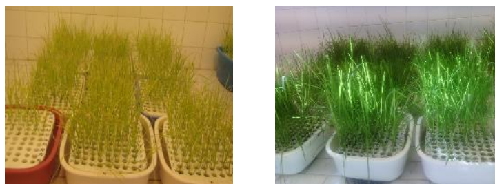
شکل ۱- الف- گیاهچه‌ها تحت شرایط نرمال و ب- گیاهچه‌ها تحت شرایط کمبود نیتروژن