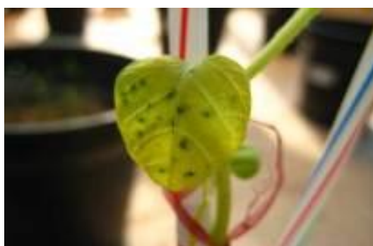
شکل ۳- نمایی از برگ‌های آلوده در شرایط گلخانه‌ای بعد از آلوده‌سازی با هر دو بیمارگر قارچی

در این ارزیابی با استفاده از بیمارگرهای قارچی Alternaria solani و Alternaria tenuissima علائم بیماری از روز سوم تا هشتم آشکار شد (شکل ۳). جدول