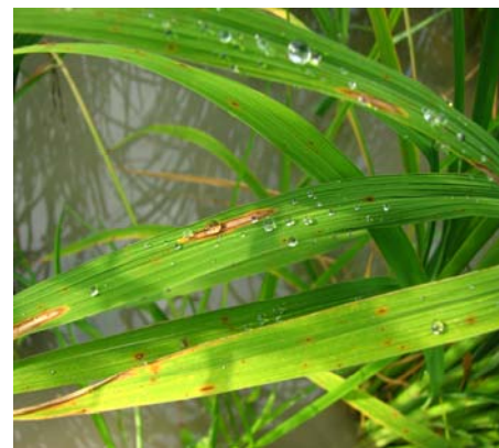
شکل ۲- نمایش لکه‌های دوکی شکل حساسیت (بالا) مربوط به والد مادری و لکه‌های کوچک میلی‌متری مقاومت (پائین) مربوط به لاینهای اصلاح شده.

در نتیجه این پژوهش دو ژن مقاوم به بلاست برنج (Pi-1 و Pi-2) به رقم حساس طارم دیلمانی منتقل شدند. رقم ترمیم شده طارم دیلمانی در مقابل جدایه‌های قارچ عامل بلاست در منطقه مقاومت نشان داد. تیپ آلودگی درجه ۴ و ۵ (حساسیت) که قبل از انجام پژوهش وجود داشت به تیپ آلودگی درجه ۱ و ۲ (مقاومت) تبدیل شد. مورفولوژی گیاه و کیفیت آن تغییر جزئی نمود اما