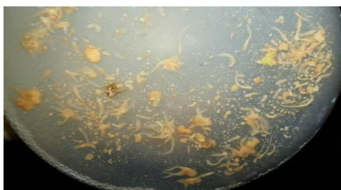
شکل ۳- جنین سوماتیکی تولید شده در محیط کشت سوسپانسیون Figure 3. Somatic embryos produced in suspension culture medium

بهترین تیمار جنین‌زایی (شکل ۳) در محیط حاوی ترکیب ۰/۱ میلی‌گرم در لیتر Zeatin و ۰/۱ میلی‌گرم در لیتر GA3 در محیط کشت سوسپانسیون سلول مشاهده شده است و بعد از این ترکیب، محیط کشت حاوی ۲/۵ میلی‌گرم در لیتر