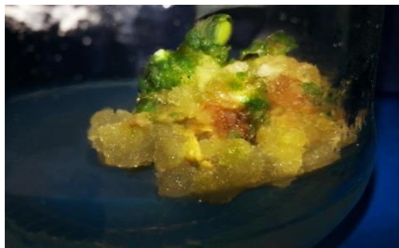
شکل ۲- کالوس القا شده از ریزنمونه برگ در رقم آریندا Figure 2. Callus induced from leaf explants in Arinda cultivar

BAP و ۵ میلی‌گرم در لیتر GA3 بالاترین میزان جنین‌زایی در محیط کشت سوسپانسیون سلولی مشاهده شده است.