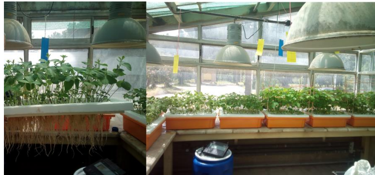
شکل ۱- نمایی از پروژه اجرا شده Figure 1. View of the executed project

صافی واتمن با پنس منتقل تا جوانه‌دار گردند. دو روز پس از جوانه‌زنی بذور عملیات انتقال آنها به محیط کشت هیدروپونیک حاوی محلول غذایی هوگلند صورت پذیرفت. بدین منظور از صفحات کاشت یونولیتی سوراخدار به ضخامت ۲ سانتی‌متر و هم سایز جعبه‌های کشت ۲۵ لیتری که کف آنها توری چسبانده شده بود استفاده گردید. کار هوادهی