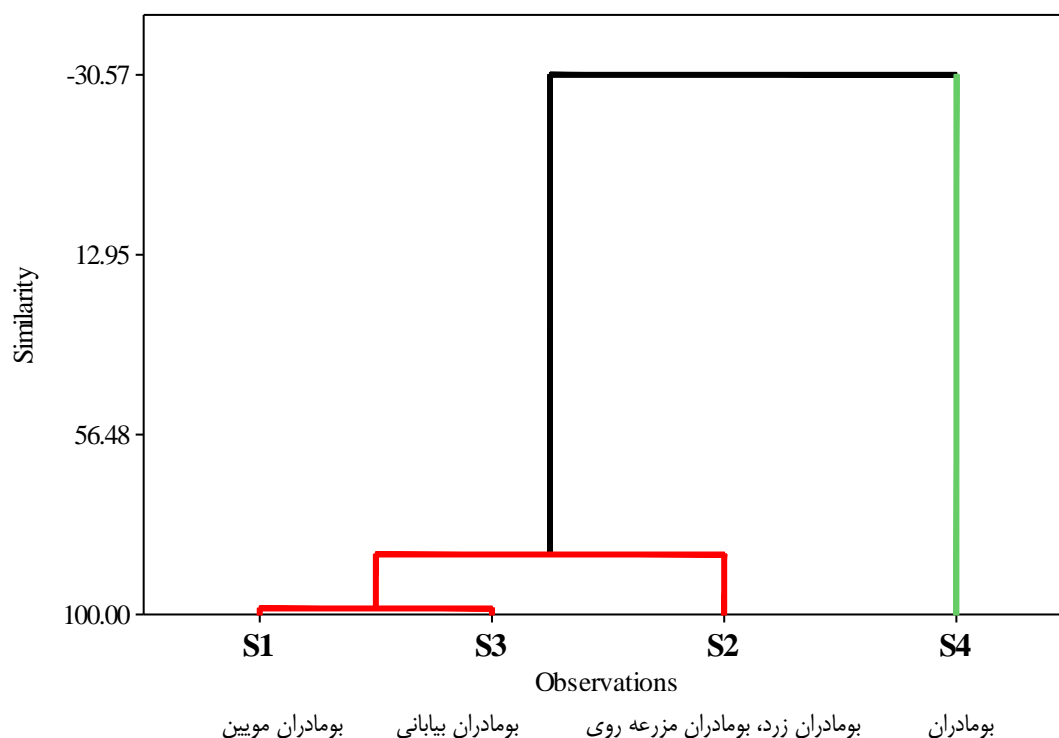
شکل ۲- دندروگرام خوشه‌ای به روش وارد بر اساس خصوصیات مورفولوژیک و بازده اسانس گونه‌های بومادران Figure 2. Cluster dendrogram using ward method based on morphological traits and essential oil percentage of Achillea species

تجزیه خوشه‌ای بر اساس خصوصیات مورفولوژیک و درصد اسانس گونه‌های مورد مطالعه را در ۲ گروه تقسیم‌بندی کرد (شکل ۲). در گروه اول گونه S4 (بومادران) قرار دارد که از نظر خصوصیتی مانند ساقه فرعی، تعداد گل‌آذین در بوته، تعداد برگ و درصد اسانس مقادیر بالاتری نسبت به سایر گونه‌ها دارد. گونه‌های S1، S2 و S3 در گروه دوم قرار دارند. گونه S1 (بومادران موئین) از لحاظ میزان ارتفاع بوته، دور ساقه اصلی، فاصله میانگره، طول و عرض برگ مقادیر