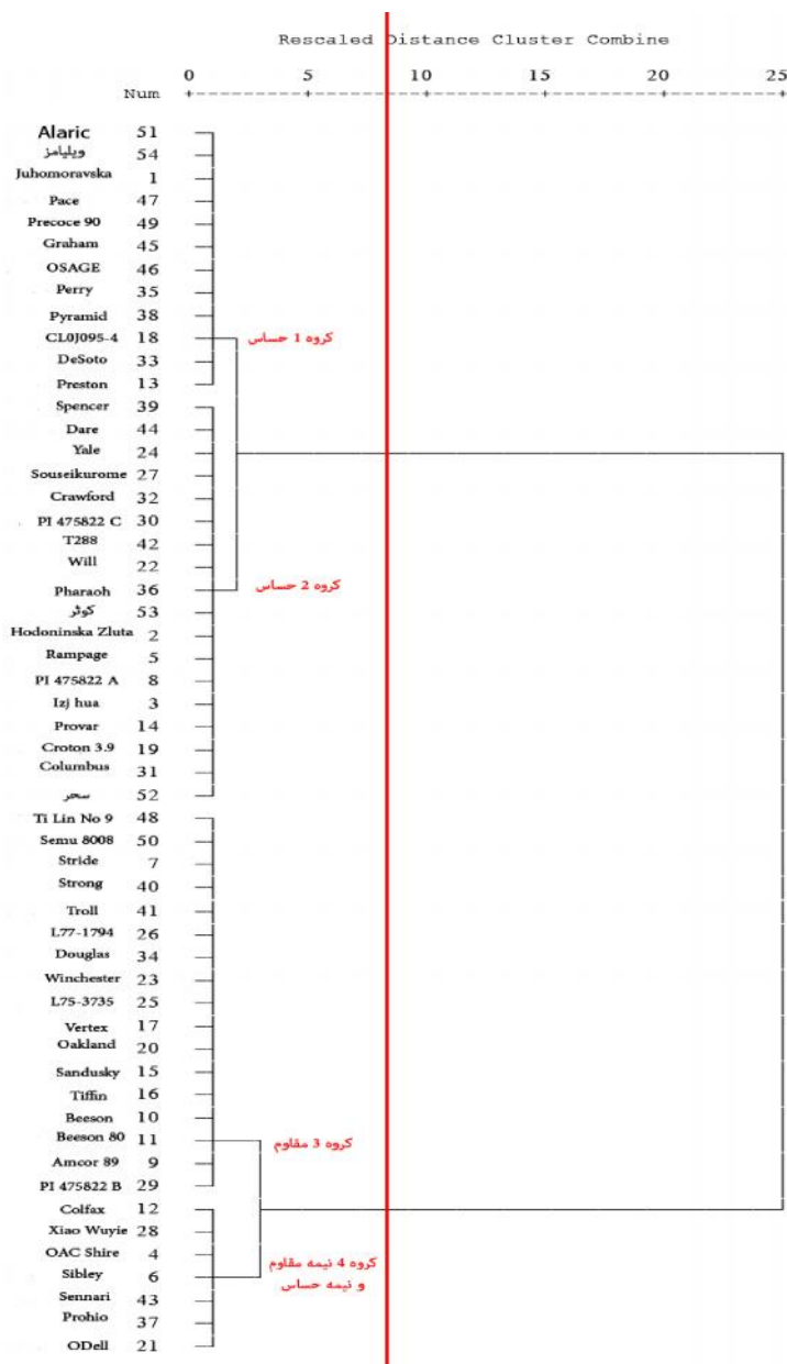
شکل ۲- کلاستر بندی ۵۴ ژنوتیپ سویا بر اساس مقاومت به بیماری پوسیدگی فیتوفترایی طوقه و ریشه Figure 2. Clustering 54 soybean genotypes based on resistance to Phytophthora rot root and crown disease

نتایج حاصل از کلاستر بندی ارقام و ژنوتیپ‌های وارداتی سویا در پژوهش حاضر بر اساس درجه مقاومت به بیماری فیتوفترایی نشان داد که نمونه‌های مورد نظر در ۲ گروه اصلی و ۴ زیرگروه دسته‌بندی شدند (شکل ۲). نمونه‌های حساس به همراه ارقام شاهد سحر، کوثر و ویلیامز در گروه‌های ۱ و ۲ قرار گرفتند. نمونه‌های مقاوم در گروه ۳ و نمونه نیمه حساس